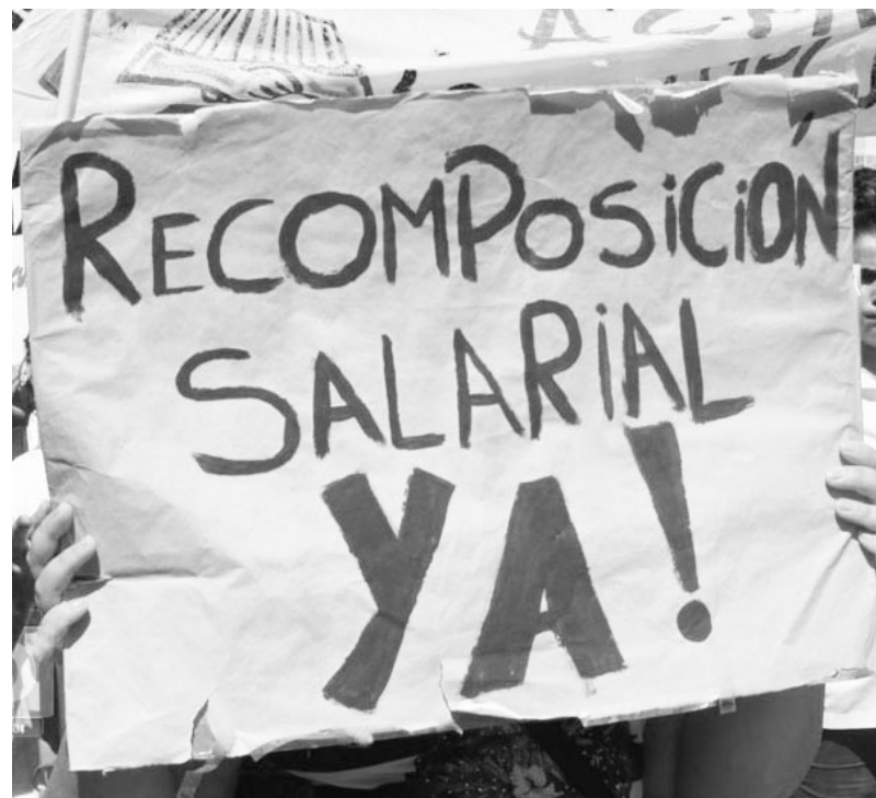
Los docentes reclaman un salario digno

José C. Paz, Lomas o Echeverría, entre otros. Inexplicablemente conducciones multicolores como Tigre, Escobar o Bahía Blanca ni siquiera quisieron realizar asambleas para resolver la unidad con La Matanza y Ensenada. Es que la CCC (PCR), el PTS y las agrupaciones de Rompiendo Cadenas, equivocadamente priorizan la unidad con Baradel y la Celeste como eje de su política, dándole la espalda a miles de docentes que quieren luchar a fondo y no apostando al desborde. Esa política, opuesta a la que realizamos los años anteriores, está debilitando a la Multicolor como alternativa de conducción en la lucha contra el gobierno de Vidal y Macri. El PO dejó correr esas posiciones durante semanas pero ahora, correctamente, cambió