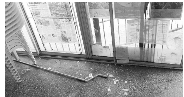
Rompieron la fachada del local con un hierro y arrojaron pintura negra

Nuestro partido viene sosteniendo una campaña activa contra el ajuste de Macri y los gobernadores, exigiendo un paro y plan de lucha a la CGT y las CTA, impulsando el paro de la docencia bonaerense para el 4 y 5 de abril junto a los médicos de Cicop y demás gremios estatales. Y es parte de la pelea contra los despidos