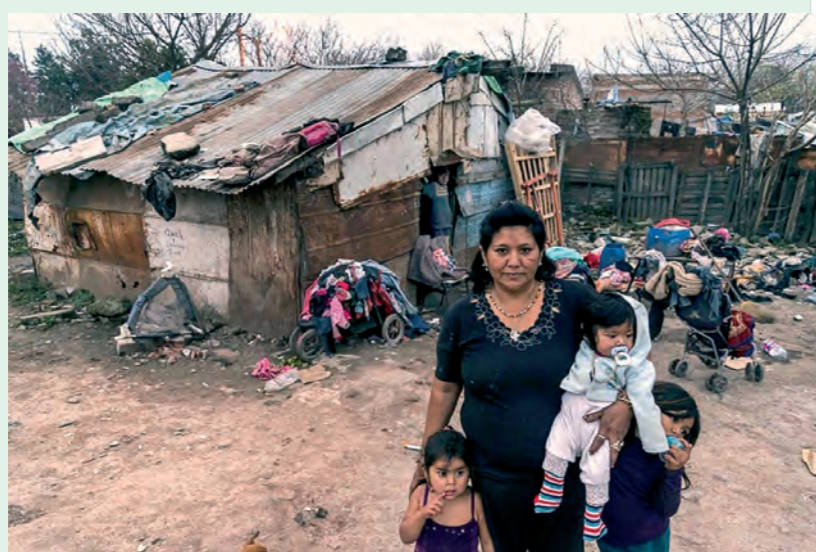
Al menos un tercio de la población está claramente en situación de pobreza

El gobierno de Macri anunció esta semana una noticia cuanto menos sorprendente. La pobreza se habría reducido a fines de 2017 a 25,7% desde el 30,3% de igual período del año anterior. En números esto significaría que la Argentina pasó de 12.300.000 a 10.400.000 pobres. Así, 1,9 millones de personas dejaron de ser pobres y habría 600.000 indigentes menos.