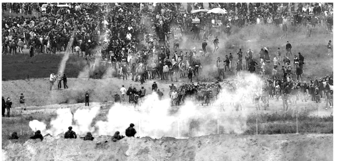
El ejército sionista reprimió la Gran Marcha del Retorno

¡Basta de agresiones al pueblo palestino! ¡Abajo el muro racista y represor de Cisjordania! ¡Libertad a todos los presos palestinos! ¡Basta del estado de apartheid de Israel! Solo con un Estado único, laico, democrático y no racista en Palestina podrá haber paz en la región. Un Estado con igualdad de derechos para todos sus ciudadanos