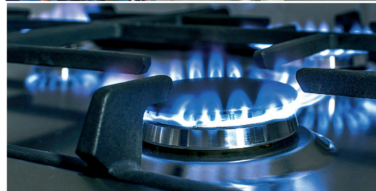
Abril comenzó con fuertes aumentos en el transporte y el gas

y las burocracias sindicales siguen firmando convenios con un máximo de 15% y en cómodas cuotas, cuando absolutamente nadie cree que esa