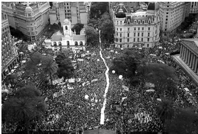
Convocatoria del kirchnerismo