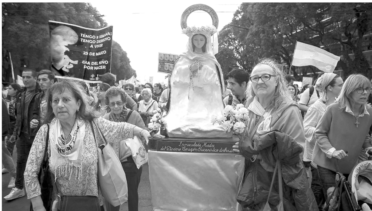
La hipocresía del discurso de la Iglesia fue protagonista en la movilización antiabortista

Los sectores antiderechos pretenden igualar la condición de feto con la de persona humana. Pero lo cierto es que un embrión no es una persona, tanto en el plano jurídico como científico. Desde el plano jurídico, por ejemplo, los derechos civiles que se puedan reconocer son para los nacidos con vida. Desde el punto de vista científico un embrión en gestación no es un ser humano, es un embrión. Es equivocado poner como sinónimos embrión/feto a bebé/persona porque no lo son. En este sentido, la única vida humana que se pone en riesgo con el aborto clandestino es la de la mujer. Por eso insistimos en que los sectores que se movilizaron no están a favor de