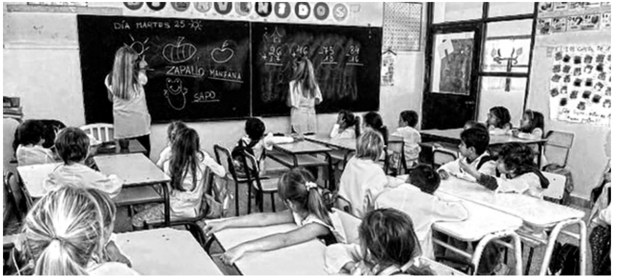
Macri continúa profundizando la destrucción de la educación pública

Lo determinante para el deterioro de nuestro sistema educativo son las causales externas. La diferencia entre las públicas y las privadas se debe a que las primeras concentran