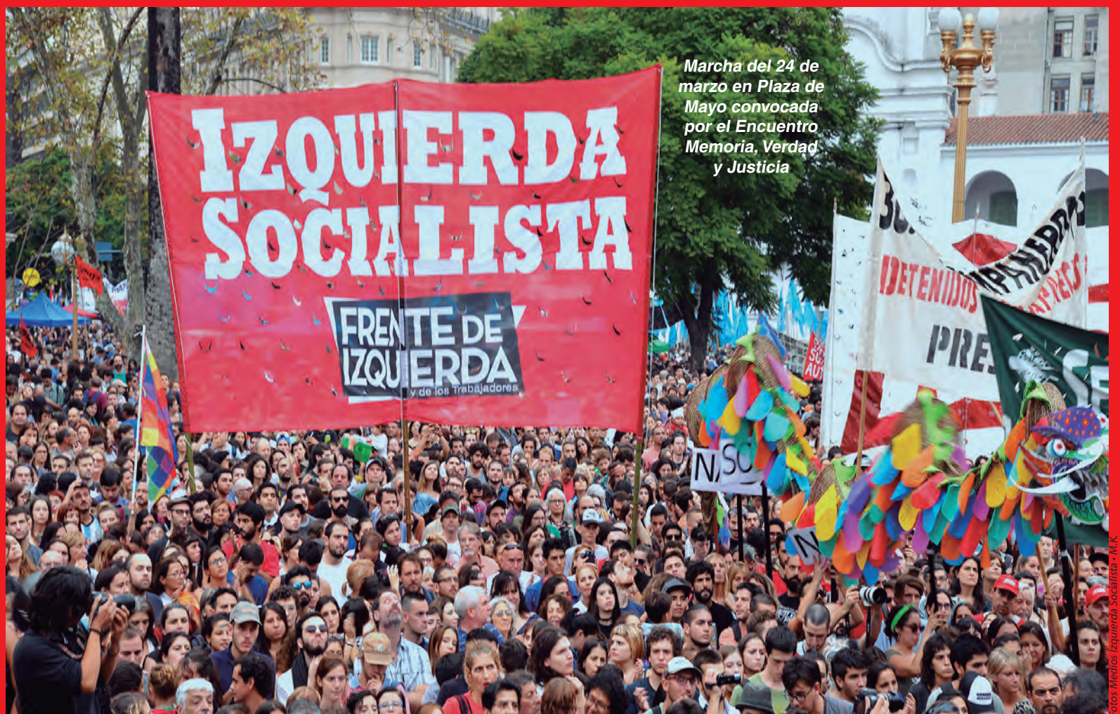
Marcha del 24 de marzo en Plaza de Mayo convocada por el Encuentro Memoria, Verdad y Justicia

Saludamos estas experiencias y llamamos a reflexionar a nuestros lectores. De lo que se trata, en definitiva, es de luchar por las transformaciones de fondo que le hacen falta a los trabajadores, las mujeres y la juventud. Invitamos a sumarse a nuestras reuniones semanales, a leer y difundir el periódico, a participar de las charlas debate y a difundir nuestras propuestas entre familiares y amigos, entre tantas actividades que se pueden llevar a cabo. Los esperamos.