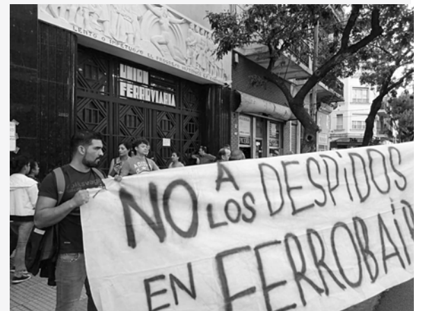
Una de las acciones de los trabajadores enfrentando los despidos

Recordemos que en 2017 fueron 1.044 los trabajadores que pasaron a Nación, dejando a 1.500 bajo la terrible presión de las gerencias, sectores políticos y la propia conducción de la Unión Ferroviaria para que firmaran los retiros voluntarios y se fueran de la empresa. El cierre de ramales, los levantamientos de los servicios al interior bonaerense y los más de 1.000 ferroviarios despedidos son responsabilidad de la Lista Verde que conduce la Seccional Sud y controla todos los ramales del interior de la provincia de Buenos Aires. La burocracia sindical traidora fue cómplice, una vez más, de un nuevo capítulo del ajuste y desguace ferroviario del gobierno de Macri y Vidal. En ese marco, la difícil lucha llevada adelante en Ferrobaires conquistó algunas reincorporaciones. Ahora la pelea debe continuar por los compañeros que faltan y todavía no pasaron a Nación, por eso los trabajadores han convocado a una nueva asamblea el jueves 5 de abril.