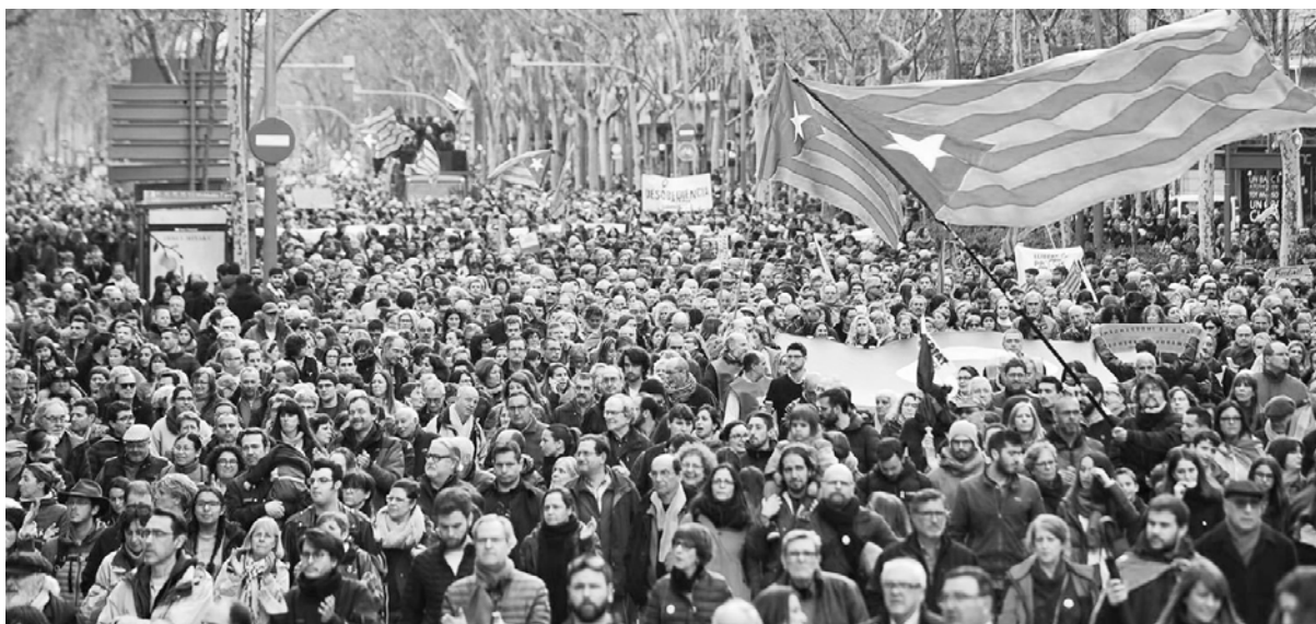
Una de las multitudinarias manifestaciones exigiendo la libertad de los presos políticos

La respuesta del pueblo catalán no se hizo esperar. Miles salieron a repudiar la detención de Puigdemont. Convocados por la Asociación Nacional Catalana (ANC) y los autodenominados Comités de Defensa de la Repú-