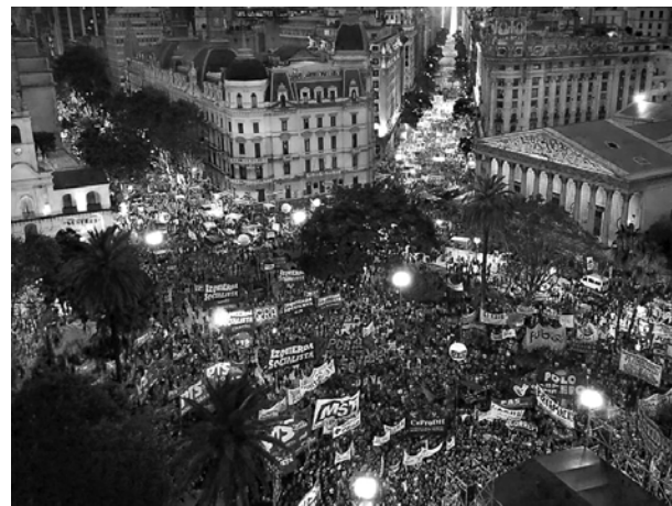
Acto del Encuentro Memoria, Verdad y Justicia

Pietragalla fue el encargado de dejar en claro que ellos estaban en contra de que hubiese dos documentos en un posible acto común del 24 de marzo, porque no aceptaban ninguna crítica a los doce años de gobierno kirchnerista ni, sobre todo, nuestras críticas a los gobernadores peronistas que hoy en día sostienen al gobierno de Macri. Pese a esta división, los medios kirchneristas como Página 12 y C5N mintieron, sosteniendo que había una sola marcha unificada, intentando ocultar la existencia de dos convocatorias.